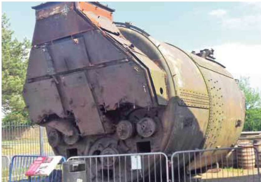
Een gigantische Schotse ketel met drie dubbele vuurgangen.

Sinds lange tijd was het niet zo lang achtereen zo warm en hebben velen van ons, ieder op zijn eigen wijze, genoten van wat de zomer te bieden had. Een mooie reis met de camper is mij ten deel gevallen. De reis ging door Schotland tot en met de Orkney eilanden met de beroemde baai van Scapa Flow waar de Britten in WO II een groot deel van de oorlogsvloot hadden geankerd. Natuurlijk niet te vergeten de woeste natuur, de grotere en kleinere musea over het grote scheepsbouw verleden in Glasgow, en over de rijke haringtijd in de kustplaats Wick.